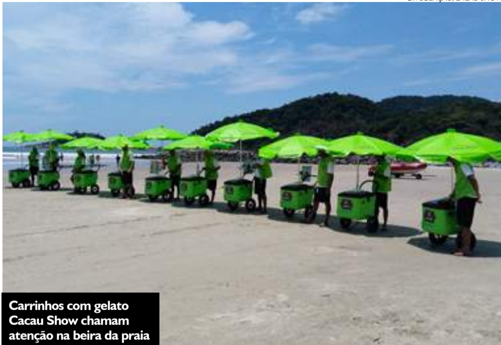
Carrinhos com gelato Cacau Show chamam atenção na beira da praia