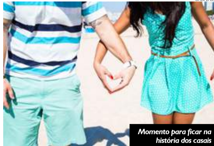
Momento para ficar na história dos casais

No sábado, 9 de fevereiro, vinte casais vão celebrar sua união em Tramandaí. Ação faz parte do projeto Pequeno Eco Cidadão