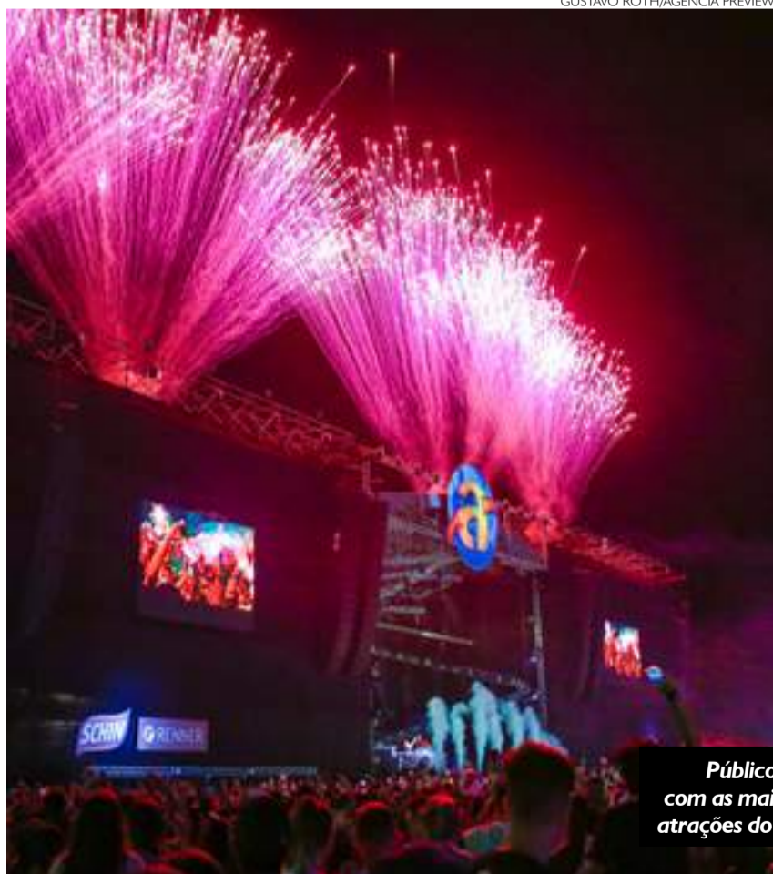
Público vibrou com as mais de 40 atrações do evento

Números do 24º Planeta Atlântida confirmam que o festival cresceu e teve 80 mil pessoas em dois dias.