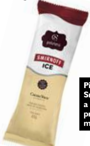
Picolé Smirnoff Ice: a novidade proibida para menores

Lançamento da Cacau Show, os gelatos vendidos em carrinhos na beira mar, conquistam adultos e crianças.