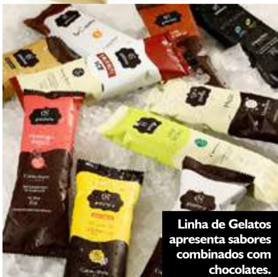
Linha de Gelatos apresenta sabores combinados com chocolates.

A temporada trouxe novidade para quem achava que a marca Cacau Show se limitava ao chocolate nos formatos barras ou trufas. A maior rede de chocolates finos do mundo, planejou o Festival de Verão e, em Capão da Canoa, por exemplo, os carrinhos de gelatos são vistos na beira mar a todo instante. Um dos lançamentos é para encantar o paladar dos adultos. A base de Smirnoff Ice, este é o gelato-novidade. Com 65 g, tem cobertura de chocolate branco. O valor sugerido pela fábrica é a partir de R$ 7,90, mas pode ocorrer de algum franquiado da marca chegar a cobrar R$ 10,00. Vale lembrar: aprecie com moderação. Se for dirigir, não consuma. Venda e consumo são proibidos para menores de 18 anos. Não compartilhe com menores de 18 anos. Há também os tradicionais sabores de Morango, Limão-Siciliano, Intensidade, laCreme, Trufa Tradicional, Mezzo, Paçoca, Mousse de Maracujá e Coco. Já na linha das trufas, as novidades são os sabores Caipirinha de Limão-Siciliano, Morango e Maracujá e Abacaxi com Hortelã, combinações queridinhas dos brasileiros, todas harmonizadas com chocolate. Fundada em 1988, a Cacau Show tornou-se a maior rede de chocolates finos do mundo. Atualmente, conta com mais de 2 mil lojas nos principais shoppings, avenidas e ruas comerciais de todo o Brasil. Especialista em chocolates com diferentes intensidades de sabor, a Cacau Show está em constante inovação e oferece uma variedade de produtos para todos os gostos e momentos.