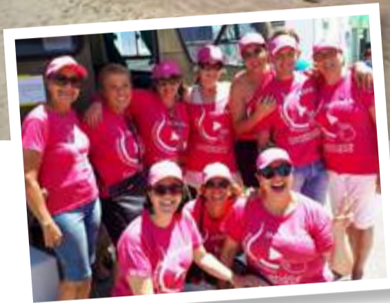
Equipe de voluntários colore a praia de rosa com diversas atividades