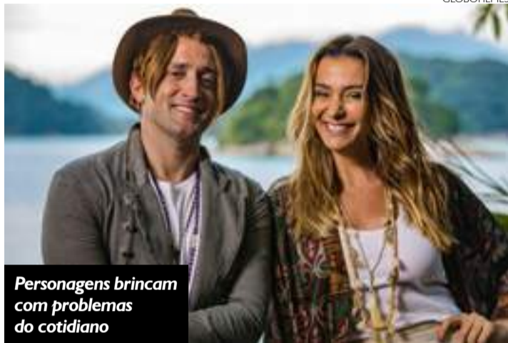
Personagens brincam com problemas do cotidiano