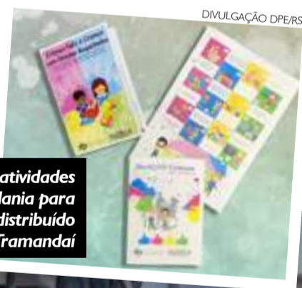
Álbum com atividades de cidadania para crianças será distribuído em Tramandaí

Programação itinerante leva atividades da Defensoria Pública para 12 localidades do litoral durante a temporada.