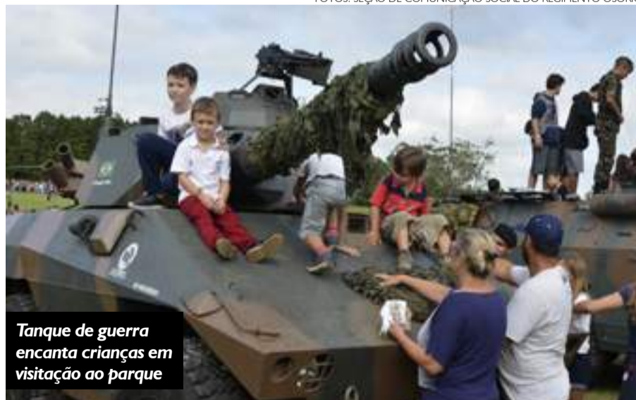
Tanque de guerra encanta crianças em visita ao parque