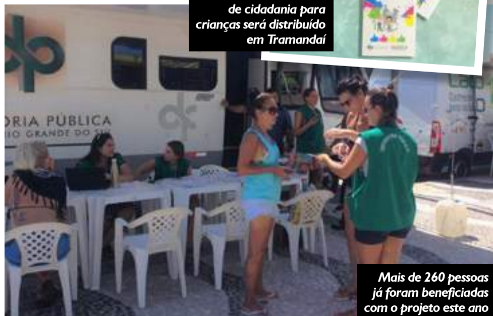
Mais de 260 pessoas já foram beneficiadas com o projeto este ano

A defesa dos direitos não tira férias. Para atender a população, a Defensoria Pública promove a terceira edição do programa "Defensoria Itinerante Temporada de Verão". A ação, iniciada em janeiro, vai percorrer ao todo 12 praias do Estado. Até o momento, mais de 260 pessoas já foram atendidas em 2019. A ação vai até 22 de fevereiro nas praias do Litoral Sul. A primeira etapa levou acesso à justiça e orientação jurídica para o Lami e Belém Novo, em Porto Alegre, e Itapuã, em Viamão. Na segunda etapa, foi a vez das praias do Litoral Norte receberem a ação itinerante, com ação em Torres, Capão da Canoa, Tramandaí, Imbé (Albatroz), Cidreira e Pinhal. A terceira e última etapa será no Litoral Sul, em Laranjal, no dia 20 de fevereiro, na praia do Cassino, no dia 21, e em São Lourenço do Sul, no dia 22. Para percorrer as praias, o programa utiliza uma unidade móvel acompanhada de equipe um defensor público, um analista e um técnico. Na ação, são esclarecidas dúvidas e entregues materiais educativos, como flyers, folders e cartilhas. Direito de família (divórcio, pedido de alimentos, guarda), pedido de medicamentos e direito do consumidor foram as principais demandas trazidas pela comunidade. "Em alguns casos,