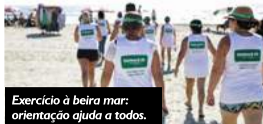
Exercício à beira mar: orientação ajuda a todos.