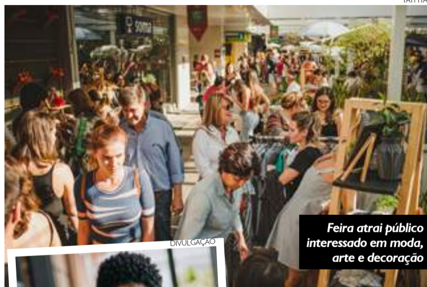
Feira atrai público interessado em moda, arte e decoração