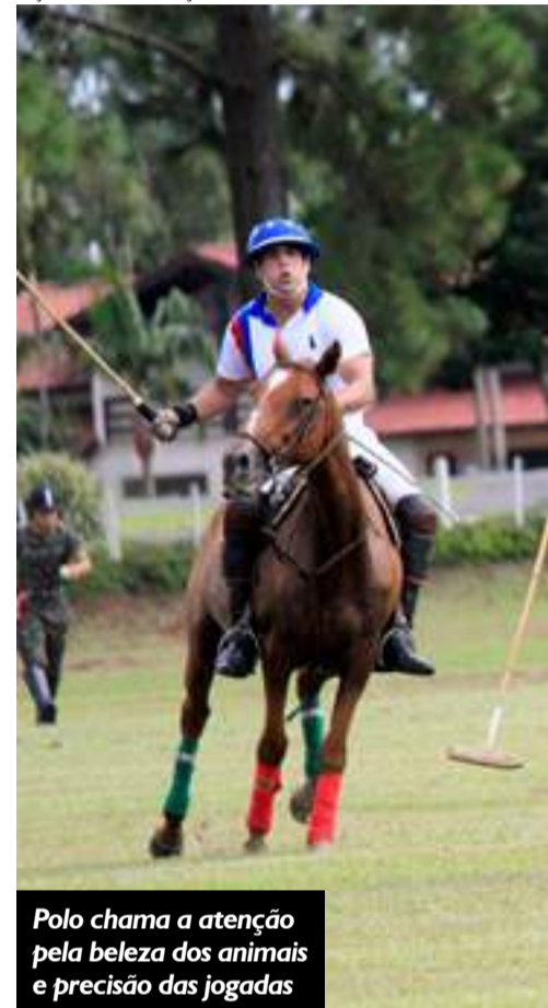
Polo chama a atenção pela beleza dos animais e precisão das jogadas

SEÇÃO DE COMUNICAÇÃO SOCIAL DO REGIMENTO OSORIO